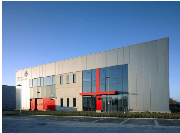
de Servaco vestiging in Wetteren waar naast Servaco Food Control, Servaco Product Testing zijn intrek neemt